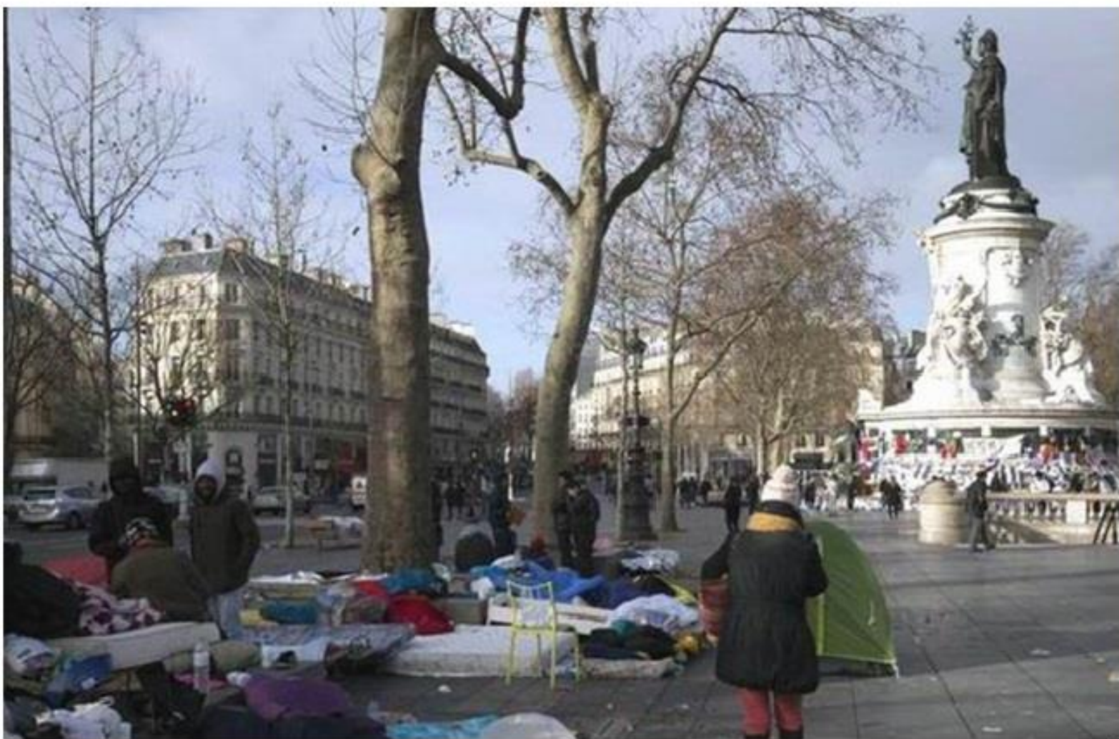
Au abords de la place de la République