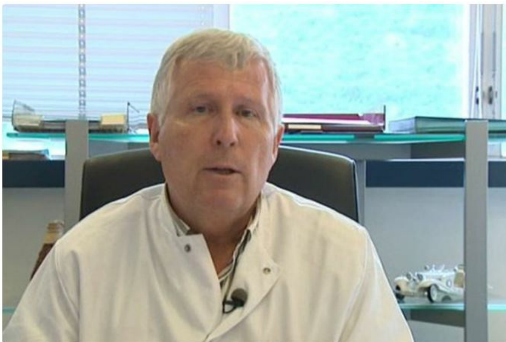
Jean-Paul Stahl • © France 3 Alpes

N°5. Le Pr Gilbert Deray de Paris. 160 649€. Une belle somme pour un néphrologue qui est très présent sur les plateaux téléés. Attention, le Remdésivir peut être très toxique pour les reins.