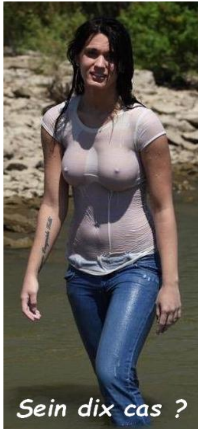
Sein dix cas ?